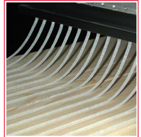
Yüzey uygulaması Elyaf ile güçlendirilmiş