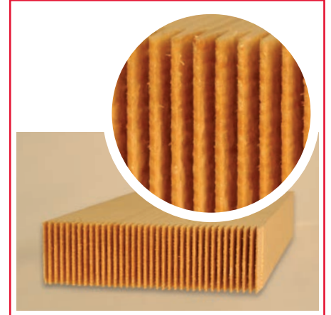
Tarak uygulaması Elyafsız / Elyaf ile güçlendirilmiş